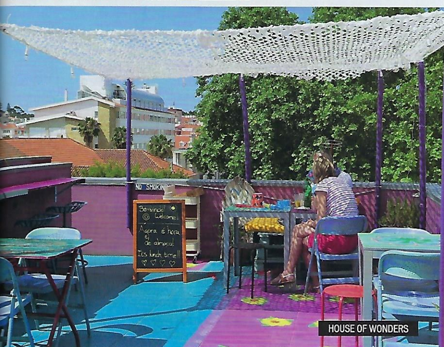
HOUSE OF WONDERS