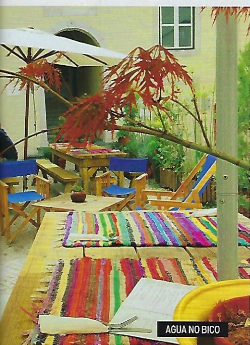
AGUA NO BICO