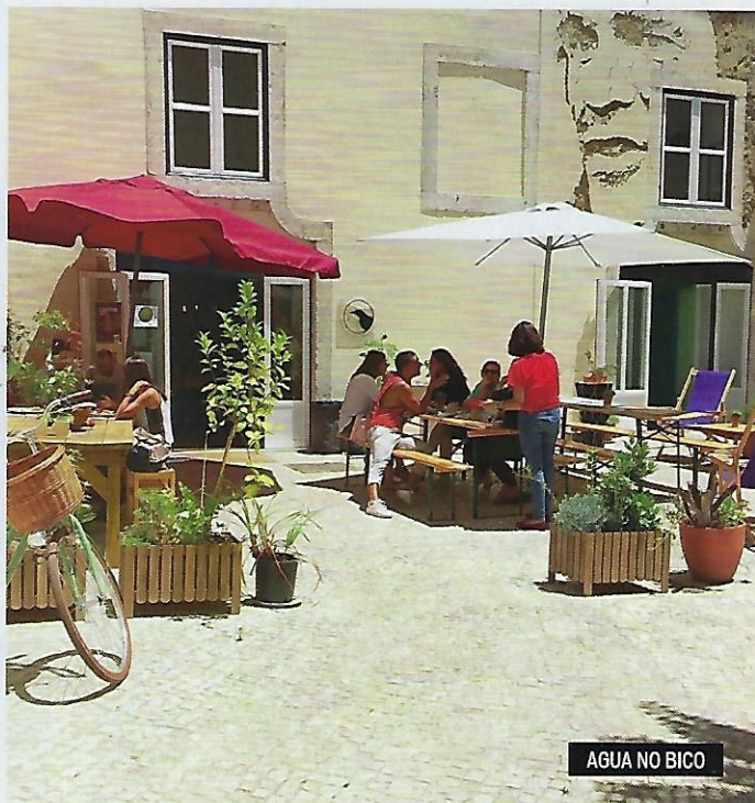
AGUA NO BICO